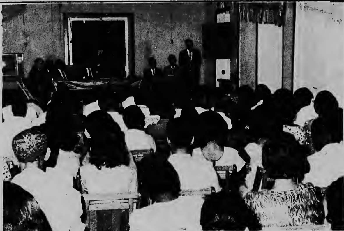
Señor H.L. Braam aki ta gradici e miembronan di SPKS pa e confianza qu nan a deposita den su persona.

Recherchenan a traha e procesverbaal corespondiente pa e ruman homber y naturalmente tambe - ela hanja un skwal pa en lo futuro e comporta su mes un poco mas humano.